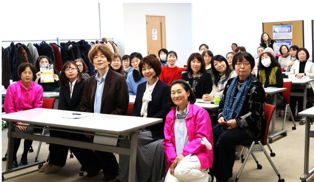
最後は皆で記念撮影